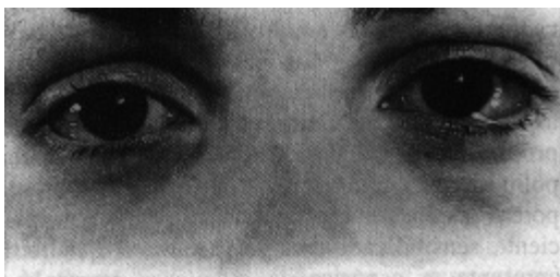
Figura 2: Paciente com rinoconjuntivite alérgica

A asma sazonal se caracterizou por: tosse, sibilos expiratórios, hiperreatividade brônquica e o diagnóstico era feito por uma queda de 20% ou mais no valor do pico de fluxo expiratório (PFE) 15 .